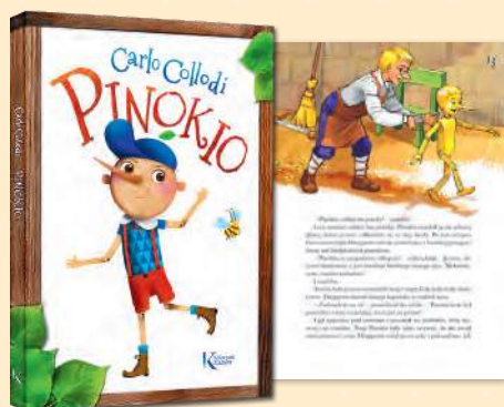
Pinokio Carlo Collodi