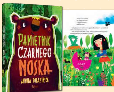
Pamiętnik Czarnego Noska Janina Porazińska