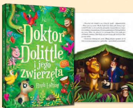
Doktor Dolittle i jego zwierzęta Hugh Lofting