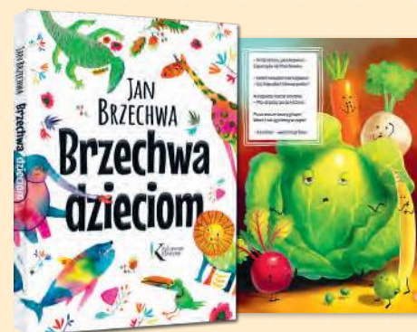
Brzechwa dzieciom Jan Brzechwa