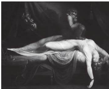
Henry Fuseli Nocna mara . Obraz odwołuje się do sfery nadnaturalnej, operuje atmosferą grozy. Przedstawia humanoidalne stworzenie siedzące na piersi śpiącej kobiety, w tle widać głowę konia-upióra.

Popularne w malarstwie romantycznym były pejzaże , zarówno ze względu na romantyczną fascynację naturą, jak i dlatego, że dawały możliwość budowania atmosfery, nastroju tajemniczości, grozy czy smutku, operowania atrakcyjnymi dla romantyków motywami – stąd często pojawiają się w pejzażach romantycznych stare zamki, ruiny, cmentarze, wzburzone morza, burze, wschody i zachody słońca, noc. Pejzaże malowali m.in. Caspar David Friedrich ( Skały kredowe na Rugii ), Joseph Turner ( Katastrofa „Minotaura” ), Théodore Géricault i Eugène Delacroix.