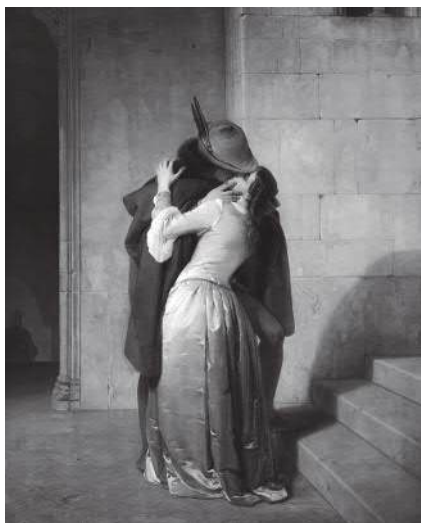
Francesco Hayez Pocłunek . Obraz odwołuje się do romantycznej fascynacji Średniowieczem, poświęcony jest tematu miłości.

Malarstwo romantyczne odeszło od wzorców klasycystycznych, od idei ładu, harmonii, elegancji formalnej. Było przesycone dynamizmem, bogate kolorystycznie , pełne ekspresji, operowało kontrastami i grą światłocieni , twórcy starali się wyrzeźbić na odbiorcy wrażenie emocjonalne. Pojawiały się motywy fantastyczne – upiory, duchy, czarownice – oraz ludowe. Nie wykształcił się jednak konkretny styl malarstwa romantycznego , ponieważ propagowano twórczy indywidualizm i nieskrępowany rozwój, więc każdy malarz mógł stworzyć własny styl.