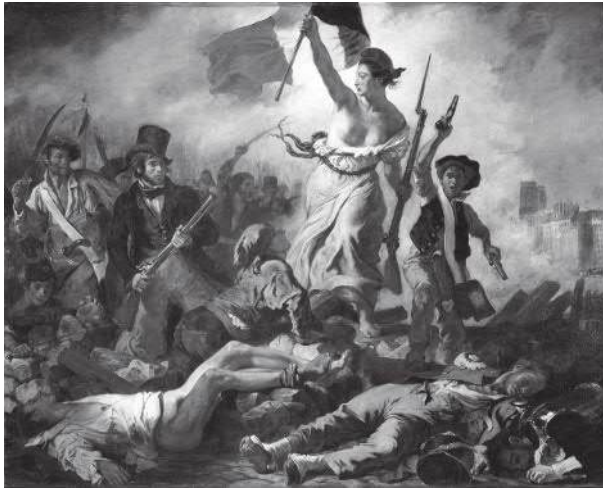
Eugène Delacroix Wolność wiodąca lud na barykady . Obraz nawiązuje do rewolucji lipcowej 1830 r., w warstwie symbolicznej odnosi się do buntu przeciw tyranii i postuluje wolność oraz równość wszystkich ludzi.