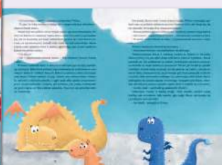
Bajki dla chłopców - przygody Różni autorzy