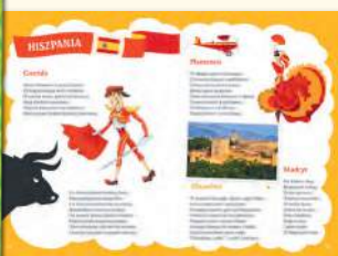
Co warto wiedzieć o krajach Grzegorz Strzeboński