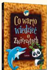
Co warto wiedzieć o zwierzętach Wiesław Błach