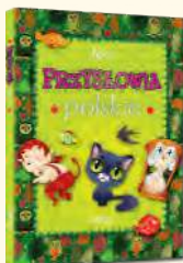
Przysłowia polskie Grzegorz Strzeboński