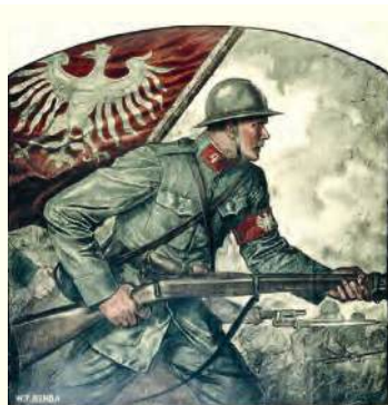
▲ Plakat rekrutacyjny Błękitnej Armii we Francji