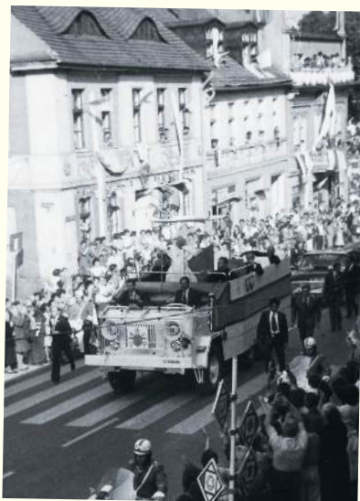
▲ Pielgrzymka papieża Jana Pawła II do Polski w 1979 r., Gniezno