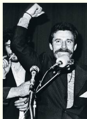
▲ Lech Wałęsa przemawiający podczas strajku w Stoczni Gdańskiej (1980)