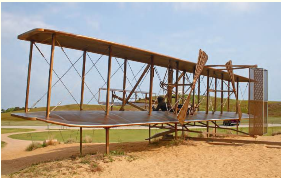
▲ Pomnik upamiętniający pierwszy lot braci Wright w Kill Devil Hills – rekonstrukcja samolotu