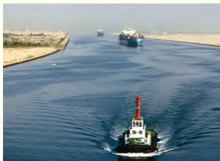
▲ Kanał Sueski