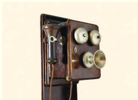
▲ Tak wyglądały pierwsze telefony (zamiast jednej słuchawki był osobno nadajnik i odbiornik)