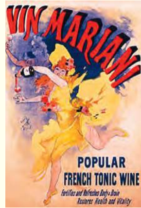
▲ Plakat wykonany w duchu epoki (lekość, wdzięk, zabawa)