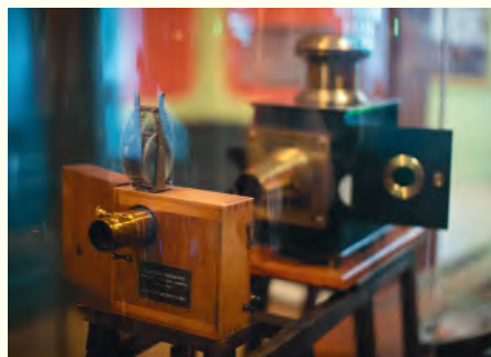
▲ Kinematograf braci Lumière