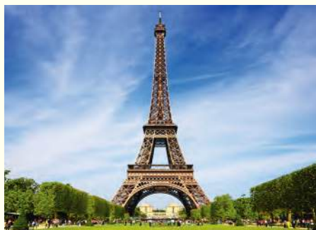
▲ Wieża Eiffla