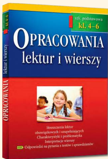
OPRACOWANIA LEKTUR I WIERSZY SZKOŁA PODSTAWOWA KLASY 4-6