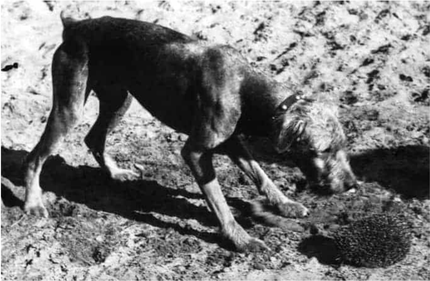
Fotografie Melchiora Wańkowicza z Kresów Wschodnich, 1937/38. N/Z: terier Wańkowiczów Gawel podczas spotkania z jeżem.

Malwinka, podprowadziwszy Gawła do legowiska, wspięła się na łapki i wobec całego areopagu kobiet chlasnęła Gawła w pysk. A kiedy stał durny, nic nierozumiejący, chlasnęła w hakowatą szurpatą mordę z jednej i z drugiej strony, aż zdecydował, że lepiej wziąć nogi za pas.