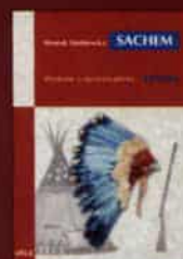
Henryk Sienkiewicz „Sachem”