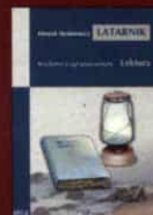
Henryk Sienkiewicz „Latarnik”