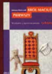
Janusz Korczak „Król Maciuś Pierwszy”