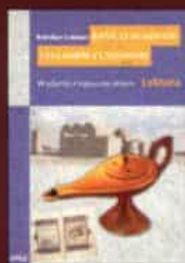
Bolesław Leśmian „Baśń o Aladynie i lampie cudownej”