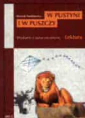
Henryk Sienkiewicz „W pustyni i w puszczy”