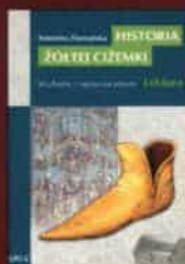
Antonina Domańska „Historia żółtej cizemki”