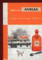
Bolesław Prus „Anielka”