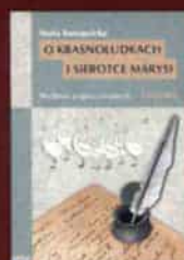
Maria Konopnicka „O krasnoludkach i sierotce Marysi”