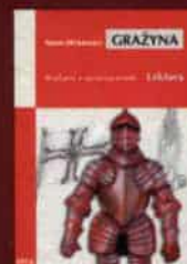
Adam Mickiewicz „Grażyna”