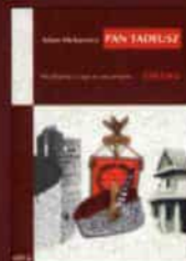
Adam Mickiewicz „Pan Tadeusz”