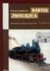
Henryk Sienkiewicz „Bartek Zwycięzca”