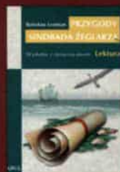
Bolesław Leśmian „Przygody Sindbada Żeglarka”