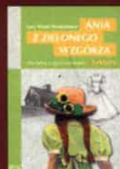
L. M. Montgomery „Ania z Zielonego Wzgórza”