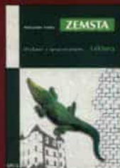
Aleksander Fredro „Zemsta”