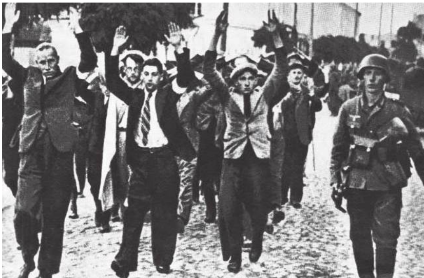
Ofiary łapanek w Warszawie

stadami na miasto. Żandarmi i gestapowcy obstawiali ulice, wygarniali wszystkich przechodniów na auta i wieźli do Rzeszy – na roboty, a zwykle bliżej – do Oświęcimia, na Majdanek, do Oranienburga 4 , osławionych obozów koncentracyjnych. Ilu przeżyło z dwutysięcznego transportu, który w sierpniu 1940 roku przybył do Oświęcimia? Może pięciu ludzi. Ilu przeżyło z siedemnastu tysięcy ludzi wytransportowanych z ulic warszawskich w styczniu 1943? Dwustu? Trzystu? Nie więcej!