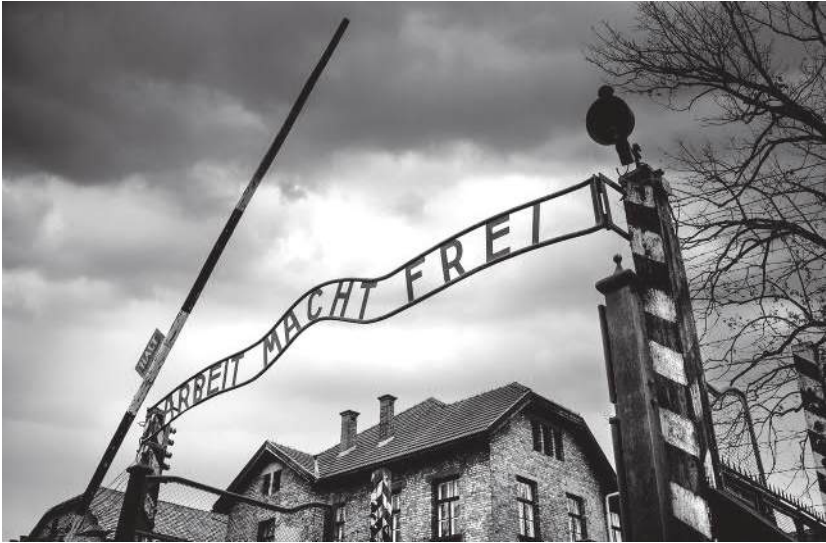
Brama z napisem „Arbeit macht Frei”

więcej. A szkoda, mogliby pomieścić tam ową niedopieczoną wątrobę ludzką, za której nadjedzenie mój przyjaciel, Grek, dostał dwadzieścia pięć na de.