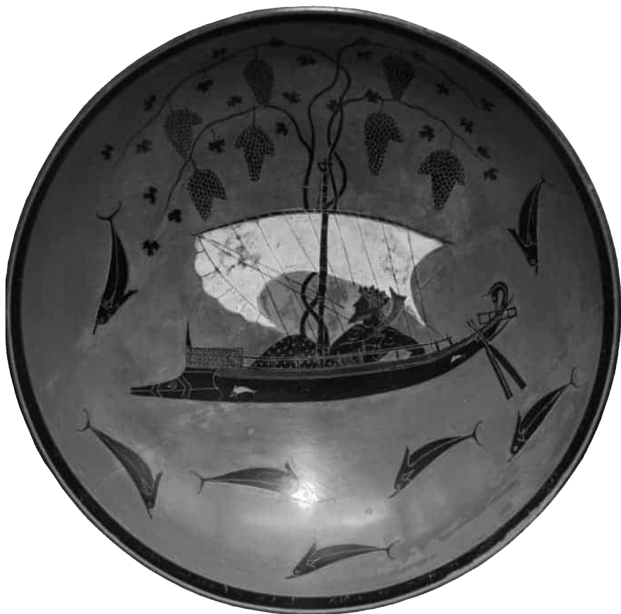
Dionizos na okręcie otoczony przez delfiny. Kyliks czarnofigurowy, VI w. przed Chrystusem.