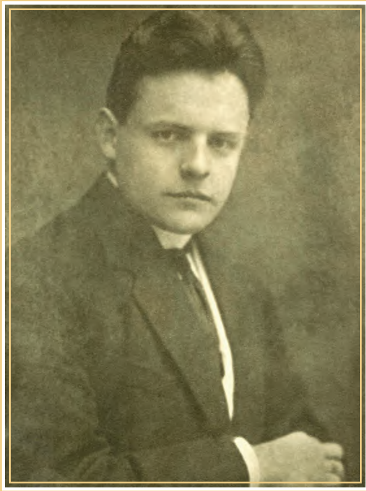
Melchior Wańkowicz w młodości, ok. 1914 r.

przyniósł córce pewnego razu kapelusz, który sam wykoncypował: były tam strusie pióra, zielony mech, liliowe wstęgi, kwiaty, wypchane ptaki – istna kanapka od Hawełki: trzy inne z jednego można by zrobić. Kobiety umierały ze śmiechu, przymierzając ten tort z osiemdziesięcioma świeczkami, ofiarowany królowej Wiktorii w osiemdziesięciolecie jej urodzin.