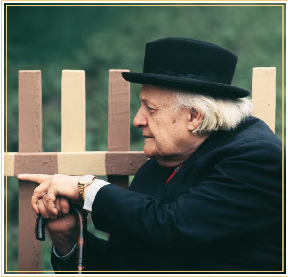
Melchior Wańkowicz, lata 70.