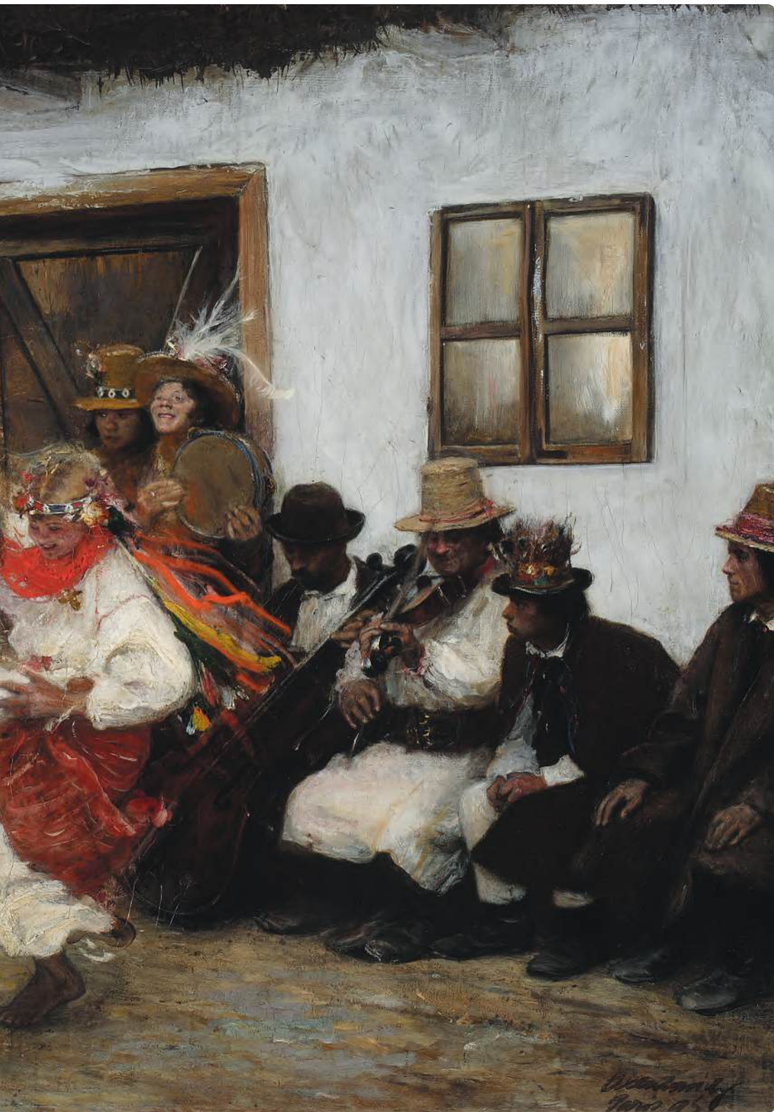
Teodor Axentowicz, Kolomyjka , 1895 r.