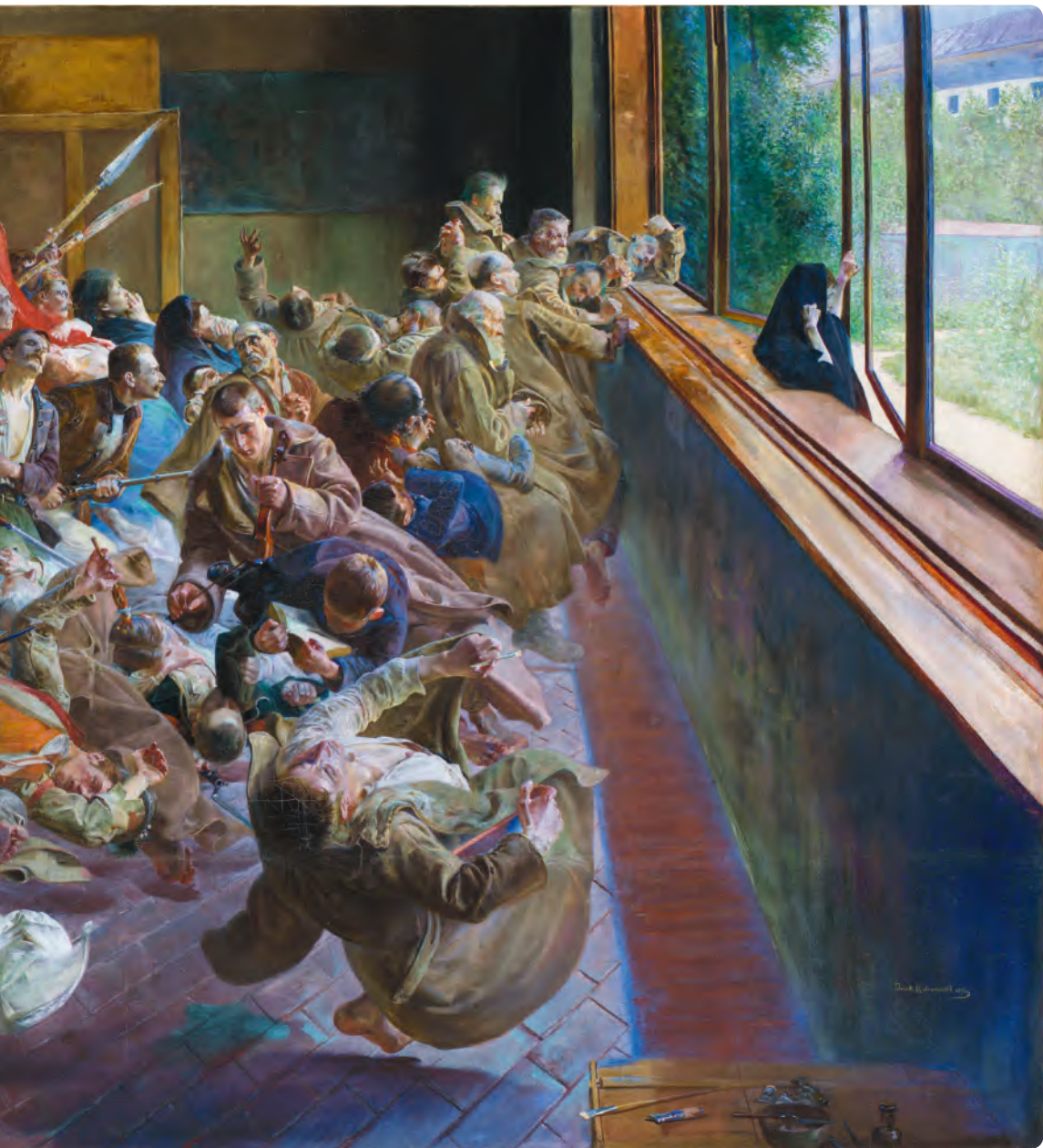
Jacek Malczewski, Melancholia , 1890–1894