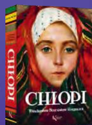
CHŁOPI Władysław Stanisław Reymont