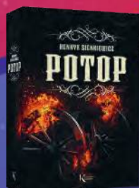
POTOP Henryk Sienkiewicz