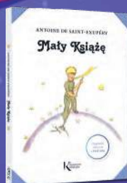
MAŁY KSIĄŻĘ Antoine de Saint-Exupéry