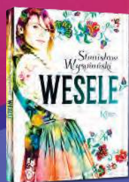
WESELE Stanisław Wyspiański