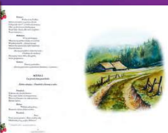
BALLADYNA Juliusz Słowacki

Poznaj inne części serii Kolorowa Klasyka!