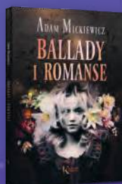
BALLADY I ROMANSE Adam Mickiewicz