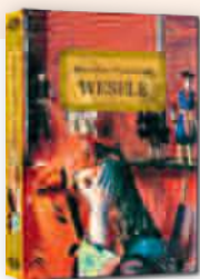
WESELE Stanisław Wyspiański

szeroki wybór lektur dla szkoły podstawowej i liceum