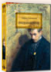
PRZEDWIOŚNIE Stefan Żeromski