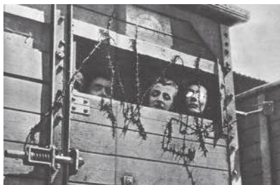
Żydzi zamknięci w wagonie towarowym

w obozie i psychicznie przygotowują się na ciężką walkę o byt. Nie wiedzą, że zaraz umrą i że złoto, pieniądze, brylanty, które zapobiegliwie ukrywają w fałdach i szwach ubrania, w obcasach butów, w zakamarkach ciała – już im nie będą potrzebne. Fachowi, rutynowani ludzie będą im grzebać we wnętrznościach, wyciągną złoto spod języka, brylanty z macicy i kieszki odchodowej. Wyrwą im złote zęby. W zabitych szczelnie skrzyniach odesłają do Berlina.